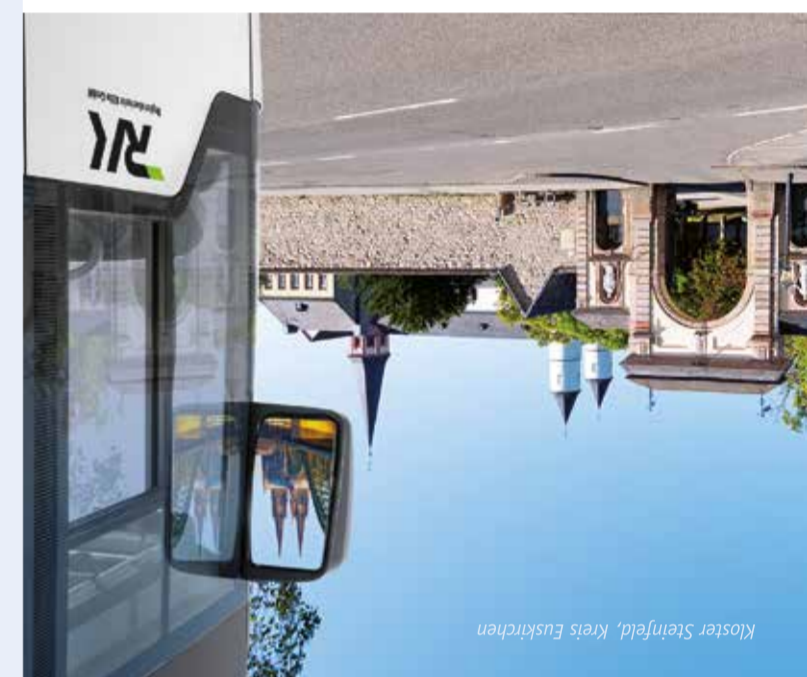
Kloster Steinfeld, Kreis Euskirchen