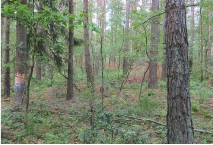
Abb. 2: Individuenreiche Strauchschicht aus Naturverjüngung gebietsheimischer Laubbäume in einem Kiefernwald der Zone IB/Gemünd im Mai 2014. Im vorhergehenden Winter wurden beigemischte Altfichten geringelt (links) und Fichten-Naturverjüngung umgeschnitten.