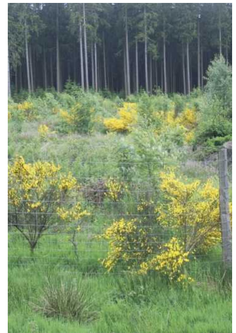
Abb. 6: Initialgatter auf einer Fichten-Windwurflläche in der Zone IC/Wahlerscheid: Vitale Naturverjüngung gebietsheimischer Gehölze in der fünften Vegetationszeit nach dem Orkan Kyrill. Jungfichten wurden im Winter 2011/12 umgeschnitten.