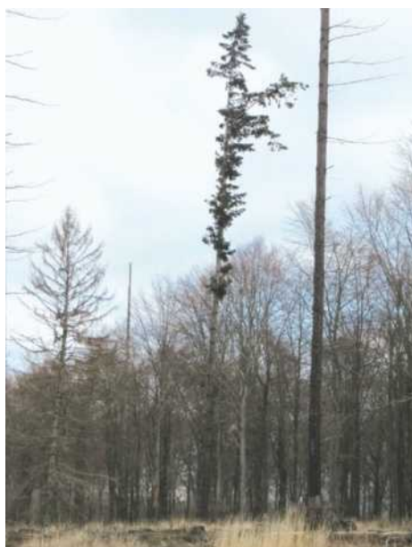
Abb. 8 und 9: Geringelte Douglasie, Brusthöhendurchmesser 50 Zentimeter: Zwei Motorsägen-Horizontalschnitte mit vertikaler Verbindung („Nießen-Schnitt“) wurden überwallt und eine neue Sekundärkrone auf halber Baumlänge ausgebildet. Insbesondere beim Ringeln von Douglasien sind hohe Arbeitsqualität und Nachkontrollen unerlässlich.