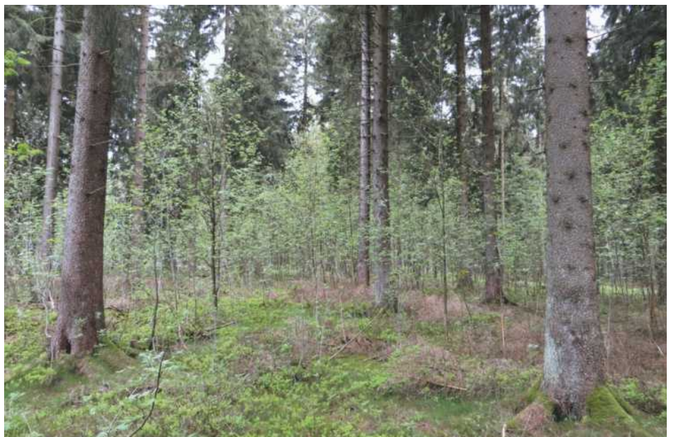
Abb. 1: Zweischichtiger Fichten-Ebereschenwald in der Zone IC/Wahlerscheid: In den fichtendominierten Hochlagen wird die Eberesche großflächig über Drosselkot eingetragen. Wird sie durch Zurückschneiden von Fichten-Naturverjüngung, schrittweiser Auflichtung der Altfichten und Reduktion der Rothirsche gefördert, ist eine Annäherung an naturnahe Waldzustände auch ohne flächige Fichtenentnahmen und Pflanzungen möglich.

Aus den genannten Gründen konnte jegliche aktive Entnahme und Zurückdrängung der Waldkiefer unterbleiben. Den Empfehlungen folgend wurde nach Entnahme benachbarter Douglasien, verstärkt ab 2011, lediglich Naturverjüngung