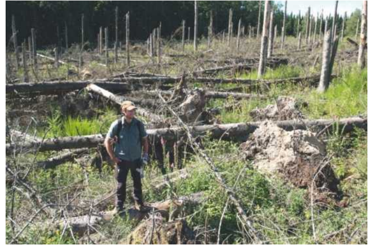
Abb. 4: Windwurf-Sukzessionsfläche in einem Fichtenwald der Zone IB/Gemünd mit vollständig belassenem Wurf- und Bruchholz in der vierten Vegetationszeit nach dem Orkan Kyrill