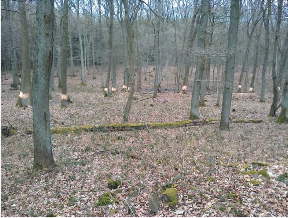
Abb. 7: Frisch geringelte, nicht gebietsheimische Roteichen in einem naturnahen Mischwald aus Traubeneiche, Hainbuche, Esche und anderen Arten in der Zone IA/Hetzingen

einigen dieser Gatter wurden ergänzend jeweils 25 Bergahorne gepflanzt, die als sogenannte „Wildlinge“ aus dichten Naturverjüngungen im Nationalpark gewonnen wurden.